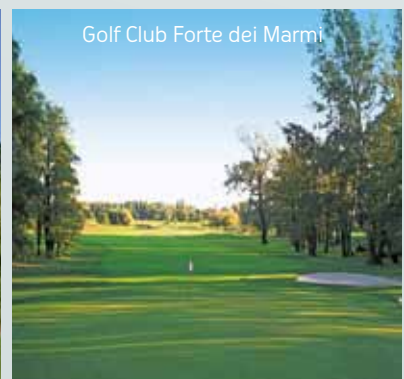
Golf Club Forte dei Marmi