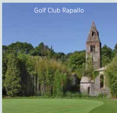
Golf Club Rapallo