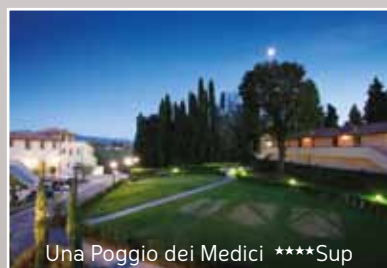
Una Poggio dei Medici ****Sup