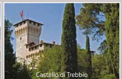
Castello di Trebbio